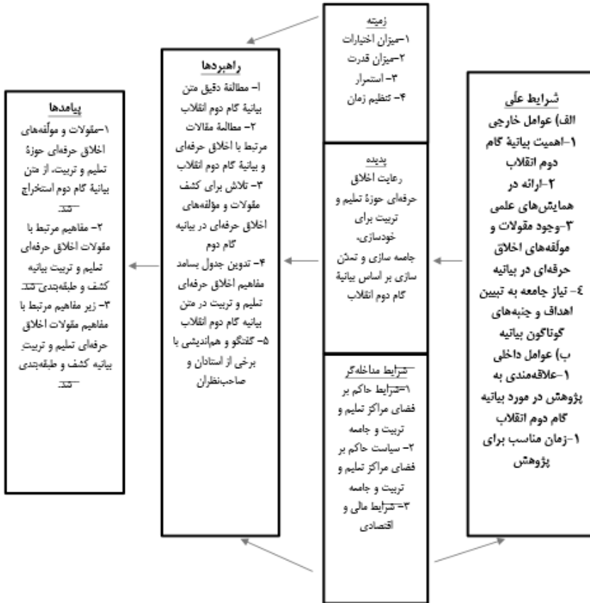
شکل ۳) نظریه‌ی داده بنیاد الگوی کدگذاری بصری

بر اساس جمع‌بندی مقوله‌ها، مفاهیم و زیرمفاهیم، مقام معظم رهبری (زید عزه) در بیانیه‌ی گام دوم، نسبت به ابعاد فردی، اجتماعی، تعلیم، تربیت، مراکز تعلیم و تربیتی، اخلاق حرفه‌ای حوزهٔ تعلیم و تربیت، استادان، کارکنان، دانشجویان، در حیطه‌های خودسازی، جامعه سازی و تمدن سازی، توجه ویژه داشته و در جای‌جای این بیانیه، به مقولات و مفاهیم قیدشده تأکید داشته است. لذا این بیانیه‌ی مهم، می‌تواند برای همه‌ی جامعه و به‌ویژه، دست‌اندرکاران حوزه‌ی تعلیم و تربیت، یک فصل الخطاب محسوب شود.